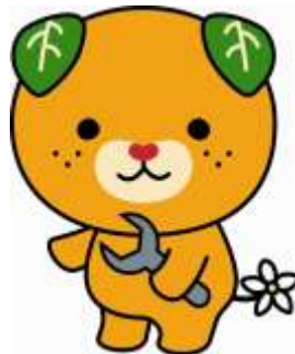
愛媛県イメージアップキャラクター「みきゃん」