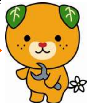
愛媛県イメージアップキャラクター 「みきゃん」