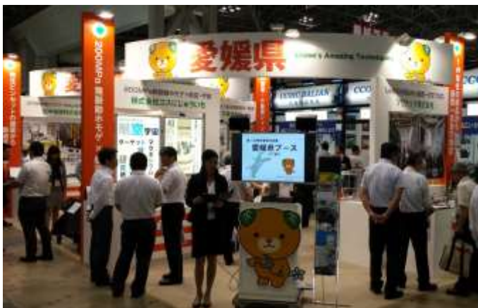
2017年 愛媛県ブース風景