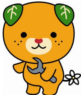
愛媛県イメージアップキャラクター「みきゃん」